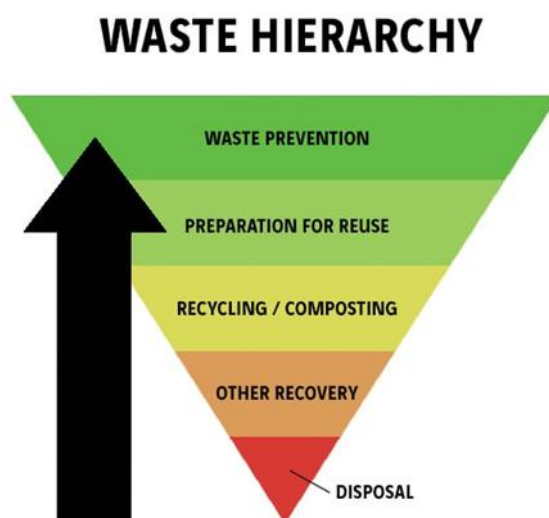
Ffigur 1: Triongl Hierarchaeth Wastraff

Rhaid ystyried hierarchaeth wastraff wrth benderfynu beth yw'r opsiwn gorau i reoli ffrwd wastraff. Mae hwn yn ofyniad gorfodol o dan Rheoliadau Gwastraff (Cymru a Lloegr) 2011. Mae'n rhoi mwy o bwyslais ar atal gwastraff, ac yn ei gwneud yn ofynnol i sefydliadau ystyried paratoi gwastraff i'w aildefnyddio, yna cyfleoedd i ailgylchu, cyn opsiynau fel adfer ynni. Yn ôl y gyfraith, mae angen i ni ddefnyddio'r hierarchaeth wastraff er mwyn sicrhau ein bod yn lleihau effeithiau ein gweithgareddau gwastraff i'r eithaf.