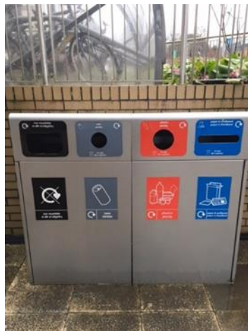
Ffigur 2 – Bin 'cwad' allanol Prifysgol Abertawe

Mae biniau 'cwad' wedi cael eu gosod ar draws campysau'r Brifysgol yn yr holl fannau cymunol, yn y manau mwyaf prysur ac wrth fynedfeydd, er mwyn gallu gwahanu gwastraff ac ailgylchu. Yn yr awyr agored, defnyddir cwads/parau metel sy'n agor o'r top gyda bagiau du ar gyfer pethau nad oes modd eu hailgylchu a bagiau clir ar gyfer ffrydiau ailgylchu (papur a cerdyn, plastig, cartonau a chaniau, a ffoil a erosolau) ddim ond i'r fanyleb a gofnodir yn Ffigur 2. Mae Ffigur 3 yn tynnu sylw at gynwysyddion gwastraff allanol eraill a ddefnyddir gan y Brifysgol ar gyfer ffrydiau ailgylchu eraill.