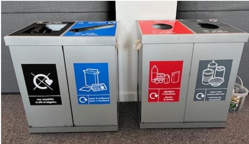
Ffigur 4 - Biniau ailgylchu Prifysgol Abertawe.