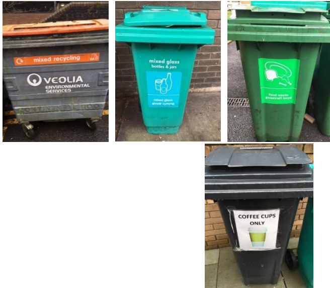
Ffigur 3 – Biniau allanol Prifysgol Abertawe, ailgylchu cymysg / ailgylchu gwydr yn unig / gwastraff bwyd yn unig / cwpanau coffi yn unig - ar archeb