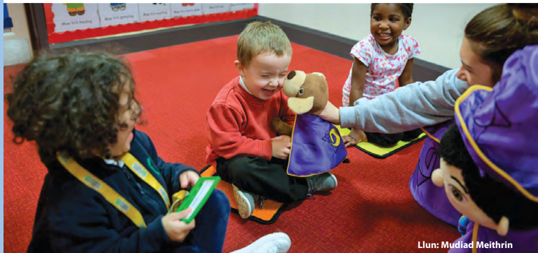
Llun: Mudiad Meithrin

Mae'r astudiaeth yn cael ei hariannu gan Ysgol Ymchwil Gofal Cymdeithasol Cymru, a'r gobaith yw y bydd y canfyddiadau'n cael eu defnyddio maes o law i helpu rhannu arferion da.